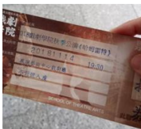
(北藝大博班實驗室有很多很酷的演講) (在系辦拿到免費的票—戲劇系秋季公演哈姆雷特)