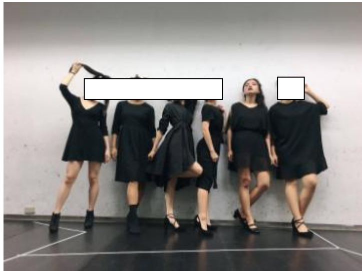
(表演課期中團體呈現－主題式走秀)

我很享受一個人創作的過程，可以自由發想劇本，獨立完成作品，不太習慣團體排練。另外，我在表演課的路上，慢慢發現我並沒有那麼喜歡表演了，這讓原本以演員為目標的我很徬徨無助，怎麼一進到北藝我對表演的愛變了?到底為甚麼?這讓我在不管上課還是排練時都很痛苦，因為我已經沒有太多熱忱支撐我去做這些工作。總之，失去一個目標，我在北藝的狀況變的很糟。