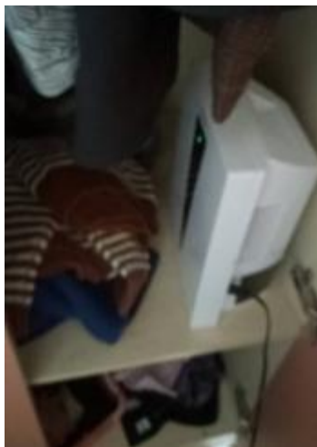
(北藝在山上很潮濕，衣櫥型除濕機好用!)

洗衣服一次 20 元，烘衣服烘乾大概要 30 元，晾衣服的地方常常爆滿沒地方晾，所以我是自己用衣櫥型除濕機（小小台的，可以放在衣櫥裡面），或者我室友都直接用烘的。順帶一提，北藝大的人很會穿搭，大部分女生都有化妝，有潮。